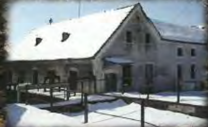
Obalov mlin, Pertloči