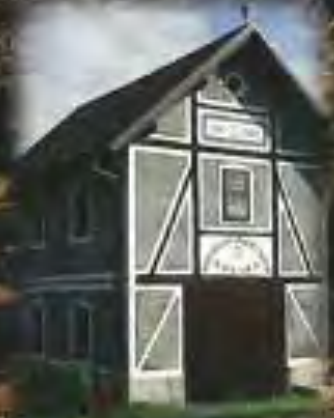
Stari gasilski dom, Sotina