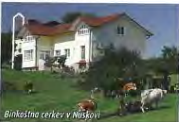
Binkoštna cerkev v Nuskovi

V večini ostalih vasi so kapele; v Fiksinch pa je še cerkev Marije Snežne iz l. 1850, ki je bila do l. 1945 župnijska cerkev za štiri nemško govoreče vasi. Poleg prevladujočih katolčanov živi v občini tudi protestantska manjšina ter pripadniki binkoštné cerkve, ki opravljajo bogoslužje v svoji cerkvi v Nuskovi. Iz te verske skupnosti izhaja tudi mešani pevski zbor Maranata.