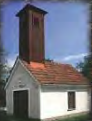
Gasilski dom, Večeslavci

V preteklosti je bilo na reki tedavi več mlinov in Zag na vodni pogon. Ostali so trije mlini: Obalov na Pertloči, Fartekov v Serdici in Dajčev v Sotini. Prva dva več ne obratujeta, Obalov valjni mlin z Zagu pa je tehnični spomenik. Zato pa sta toliko bolj ohranjena dva stara gasilska domova. Eden je v Večeslavcih, drugi v Sotini. Sotinski je iz l. 1933, v njem pa se načrtuje muzej starih gasilskih orodij.